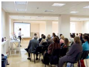
Научно-практический семинар для наших клиентов