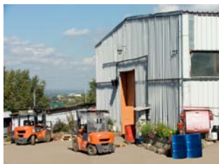
Центральный склад в Уфе