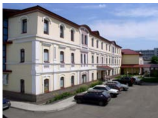
Центральный офис в Уфе

ЗАО «Химреактивснаб» основано в 1995 году. За годы успешной работы на рынке оснащения химических лабораторий мы накопили опыт и заслужили репутацию одного из крупнейших и надёжнейших поставщиков в России и ближнем Зарубежье.