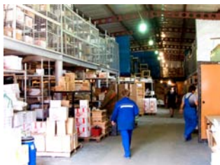
Складские базы в Уфе, Хабаровске, Красноярске, Екатеринбурге, Орске